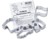
koekjes voetbalset van € 5,50 voor € 4,65