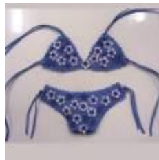
bikini uitstekerset van € 16,50 voor € 14,--