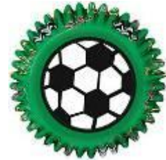
voetbal cupcake vorm van € 2,50 voor € 2,15