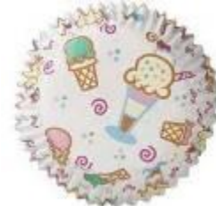
ijsje cupcake vorm van € 2,50 voor € 2,15