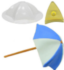
Parasol van € 13,25 voor € 9,95

De maanden juli en augustus staan voor de meesten van ons in het teken van de zomervakantie en dus hebben we weer leuke aanbiedingen voor u geselecteerd.