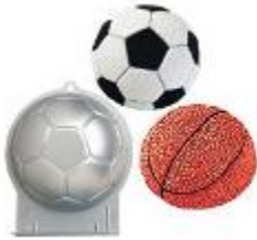
voetbal bakblik van € 14,50 voor € 12,30

Speciaal voor het WK voetbal en Vaderdag en hebben wij leuke aanbiedingen voor de maand juni, hieronder een kleine greep uit de aanbiedingen. Wees er snel bij want OP=OP